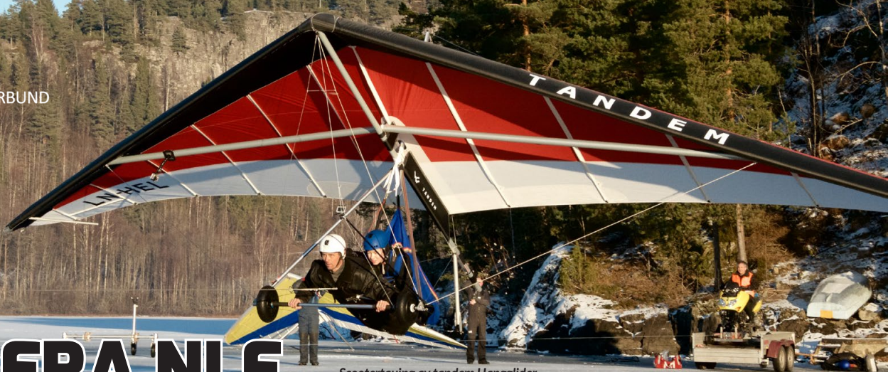
Scootertauing av tandem Hangglider. Pilot: Reidar Berntsen.